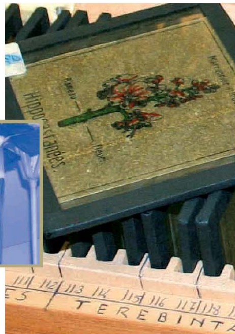
Herbario Escuela Técnica Superior de Ingenieros Agrónomos